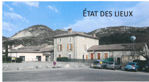
ÉTAT DES LIEUX

LES PLANS DE CETTE RESTRUCTURATION SONT VISIBLES EN MAIRIE LE MARDI MATIN DE 9 H À 12 H