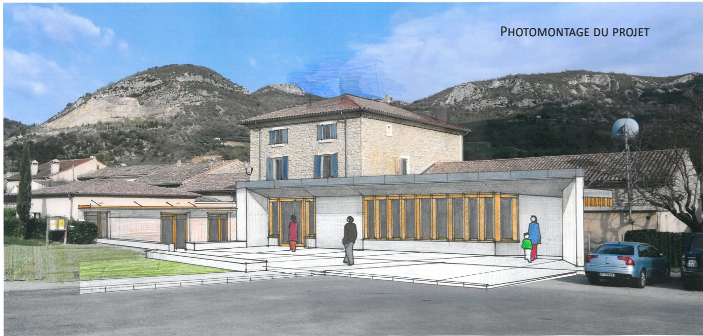
PHOTOMONTAGE DU PROJET

LES PLANS DE CETTE RESTRUCTURATION SONT VISIBLES EN MAIRIE LE MARDI MATIN DE 9 H À 12 H